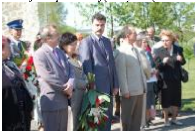
Przedstawiciele konińskich władz