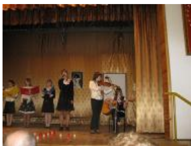
Kłódawscy uczniowie w części artystycznej