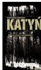
W. Odojewski „Milczący, niepokonani. Opowieść katyńska Wydawnictwo: Twój Styl