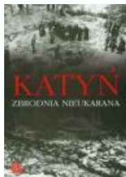
Katyn. Zbrodnia nieukarana.

Książka poświęcona jednej z najtragiczniejszych kart najnowszej historii Polski. Oparte na oryginalnej dokumentacji kompendium podstawowej wiedzy o bezprecedensowym ludobójstwie dokonany przez reżym sowiecki wiosną 1940 r. na bezbronnych jeńcach wojennych i więźniach - obywatelach II Rzeczypospolitej, a także o trwającej wiele lat walce o ujawnienie prawdy o tej zbrodni i jej sprawcach.