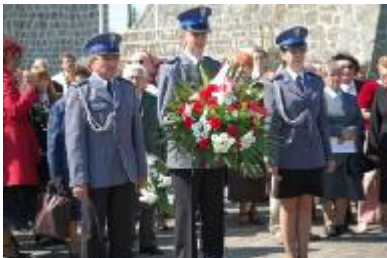
Delegacja konińskiej policji