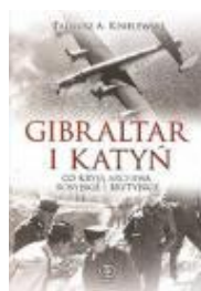
T.A.Kisielewski Gibraltar i

Katyn zajmuje w naszej pamięci narodowej miejsce szczególne. Jest bowiem symbolem sowieckich zbrodni wojennych popełnionych na Polakach podczas II wojny światowej. Znamienne, że pamięci Katynia, jego wyrazistej obecności w świadomości historycznej narodu polskiego, nie zdołały osłabić ani wieloletnie kłamstwa, ani rozmyślne przemilczenia, ani natrętna propaganda. Swoistym paradoksem jest natomiast niebezpieczna relatywizacja tragicznej pamięci w miarę krzepnięcia III Rzeczypospolitej.