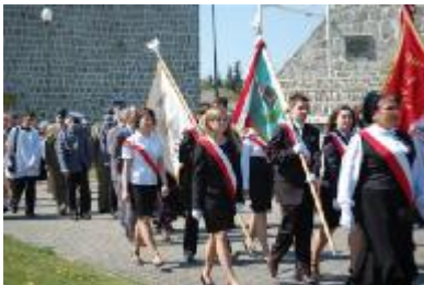
Przejście pod stację katyńską